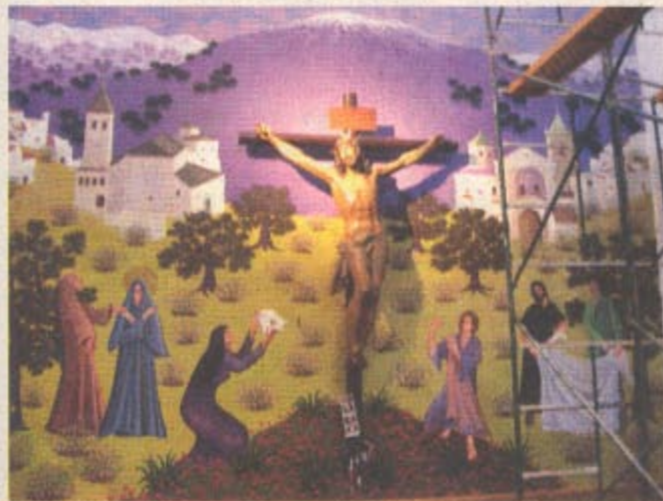
Der Bergriese Maroma, die Kirche Santa María La Mayor, das Convento de San Francisco und Szenen um die Kreuzigung Jesu.