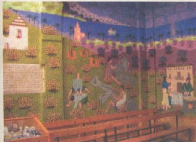
Der Palacio de Beniel und die Küste östlich von Vélez-Málaga mit dem Leuchtturm von Torrox Costa und einem Boot vor Caleta.